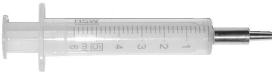
Seringa 5 ml em polietileno com ponta de metal Peça nº 0902000125