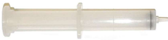
Seringa de 5 ml em nylon, de ação inversa Peça nº 0902000127

De modo a fazer o teste de deteção de água, oferecemos uma série de seringas de 5ml reutilizáveis. Seringas com especificação médica de custo reduzido não devem ser utilizadas para fazer o teste porque muitas vezes têm a ponta com tamanho incorreto, não cabendo na cápsula de deteção de água, além de que têm uma vida útil demasiado curta. No entanto, apesar de cada seringa reutilizável poder ser utilizada mais do que uma vez, também têm um tempo de vida útil que depende em larga escala do tipo de seringa, especificações do combustível, condições ambientais e modo de utilização, daí que seringas sejam sempre um consumível. Ao longo do tempo, os vedantes vão inchar e o nylon vai expandir, tornando a seringa inutilizável. Existe uma seringa alternativa de Polietileno que não tem vedante de borracha e tem uma ponta de metal que tem uma tendência inferior a ficar inutilizável, oferecendo uma vida útil mais longa. Desenvolvemos também uma seringa de ação inversa operável com apenas uma mão. O êmbolo é empurrado em vez de puxado de modo a remover a amostra de combustível, sendo mais conveniente de usar quando o operador está a usar luvas grossas enquanto executa o teste.